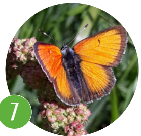
23 LIKES | S. K. (TIROL) LILAGOLD-FEUERFALTER